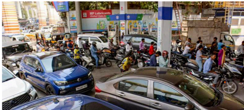
PANIC BUYING. Consumers throng a petrol station in Thane

The global situation remains in flux, and the government is closely monitoring developments across energy, supply chains and essential commodities on a