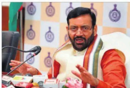
CM Nayab Singh Saini in Chandigarh on Saturday.

Regarding cooking gas, he said the situation is satisfactory. The state receives about two lakh cylinders daily and distributes around 1.9 lakh cylinders. Adequate