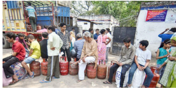
Waiting game: People queuing up to refill their LPG cylinders outside a gas agency in New Delhi on Saturday.

The impact is also visible across central Delhi,