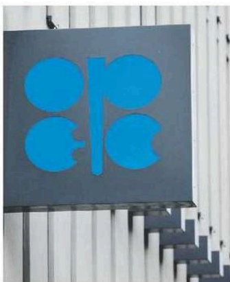
UAE's decision may weaken Opec's control over oil prices. AFF

gas, Grant Thornton Bharat said the UAE's exit is likely to increase global oil supply flexibility in the medium term as the Emirates would be free from Opec mandates which could soften crude prices. "It is likely to be beneficial for India's import bill and inflation in that sense." However, in the short term, such events typically lead to market volatility and geopolitical uncertainty, requiring India to strengthen supply diversification and bilateral energy ties, he said.