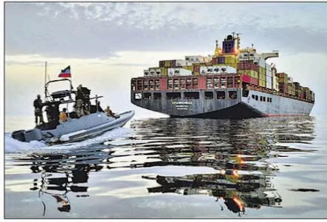
हार्मुज में एक तेल टैंकर को जब्त करने के लिए उसकी ओर बढ़ती ईरानी बोट।

हार्मुज में जल्द शुरू हो निर्बाध आवागमन: इस बीच संयुक्त राष्ट्र सुरक्षा परिषद में भारत ने कहा है कि हार्मुज में जल्द सुरक्षित और निर्बाध तरीके से आवागमन शुरू हो। सोमवार को समुद्री क्षेत्र में जलमार्गों की सुरक्षा और संरक्षण विषय पर खुली बहस के दौरान संयुक्त राष्ट्र में भारत के स्थायी मिशन की प्रभारी राजदूत योजना पटेल ने यह बात कही।