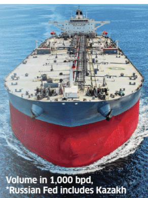
Volume in 1,000 bpd, *Russian Fed includes Kazakh