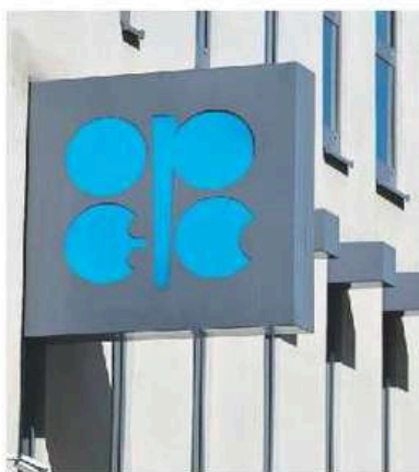
UAE exit could create disarray and weaken Opec.

UAE energy minister Suhail Mohamed al-Mazrouei said the decision was taken after a careful look at the regional power's energy strategies. "This is a policy decision, it has been done after a careful look at current