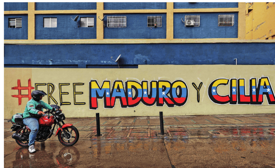
NOT PUMPED ABOUT VENEZUELA: Investors will be wary of pouring capital into a legal vacuum under a socialist govt whose legitimacy is contested

Experts estimate it would take $10 billion per year for ten years to repair Venezuela's infrastructure. Output might rise quickly from 1m barrels per day to 1.5m, but anything more would take years. Wood Mackenzie estimates break even prices for Venezuela's sour (acidic and sulphurous) and extra-heavy oil from new projects at above $80 a barrel, whereas the market price right now is around $45/barrel. Chevron, the lone American major currently operating in