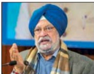
Union Minister for Petroleum and Natural Gas Hardeep Singh Puri

In a post on the social media platform X, the minister noted that India's energy planning is being tested every day in real-world conditions, in homes, on roads, and across workplaces, where forecasts meet lived reality. He pointed to the expansion of piped natural gas (PNG) connections, noting that around 1.58 crore kitchens across the