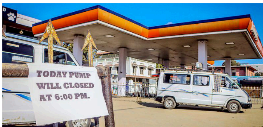
In protest: A petrol pump stands closed in the Imphal Valley during a protest by fuel outlets on Saturday, following security threats and a recent bomb blast at a fuel station.

"Though the authorities have taken up strict actions/steps towards the safety of the petrol pumps/dealers, yet we are facing severe threats," the letter