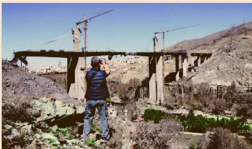
The 136-metre-high B1 bridge in Iran’s Karaj has been partially destroyed by joint US-Israeli strikes on Thursday. It is the tallest bridge in West Asia

India has sharply increased imports of Russian crude oil as supplies from the West Asia region have been disrupted by