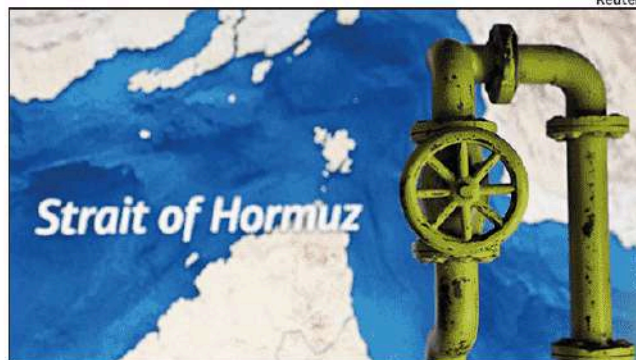
Two Indian-flagged ships, Green Asha and Jag Vikram, loaded with LPG and stranded west of Hormuz may soon head to India as well

Now 17 Indian ships remain stranded west of the Strait of Hormuz, including two — Green Asha and Jag Vikram — loaded with LPG. These two may soon head to India as well, people aware of the developments said. TOI on Thursday had reported that the three LPG carriers were currently drifting northeast of Abu Musa Island in the Persian