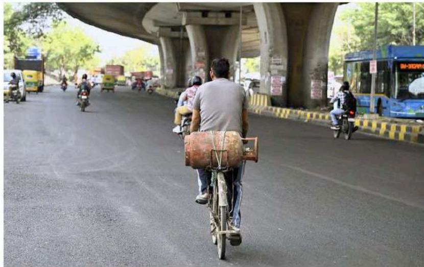
A Delhi resident carrying a refilled LPG cylinder from a gas depot in New Delhi on Friday. SHIVKUMAR PUSHPAKAR

Mr. Jha said that while earlier domestic LPG cylinders were delivered within