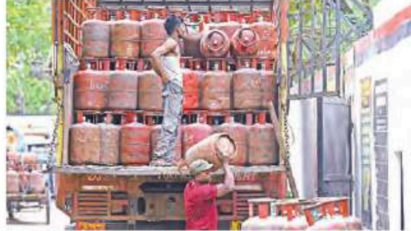
A worker off-loads LPG cylinders from a carrier truck for distribution amid the ongoing West Asia war in New Delhi

"Wherever PNG connections are available, residents should shift from LPG to PNG," he said, adding that the