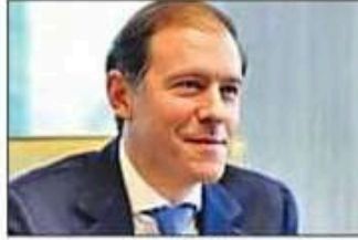
रूसी उप प्रधानमंत्री डेनिस मांतुरोव

रूस के उप प्रधानमंत्री डेनिस मांतुरोव ने राष्ट्रीय सुरक्षा सलाहकार अजीत डोभाल, वित्त मंत्री निर्मला सीतारमण और विदेश मंत्री एस जयशंकर से बृहस्पतिवार को मुलाकात के दौरान ऊर्जा सहयोग बढ़ाने पर जोर दिया। बाद में मांतुरोव ने प्रधानमंत्री नरेंद्र मोदी से मुलाकात की। अमेरिकी प्रतिबंध में मिली ढील के बाद रूस से तेल-गैस आयात में बीते महीने 90