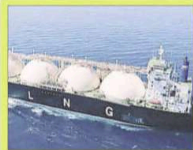
■ In March, Oman emerged as the top supplier with a share of 31.5% ■ Qatar's share fell from about 39.6% in February to 3.6% in March

February (about 39.6% share) to just 0.06 MT, or 3.6%, in March, reflecting a near-complete disruption in flows. In contrast, Oman emerged as the top supplier with 0.53 MT, accounting for a 31.5% share in March, followed by the United States at 0.34 MT (20.2%) and Nigeria at 0.33 MT (19.6%), highlighting a rapid pivot towards alternative sources. Additional volumes came from Angola at 0.21 MT (12.5%) and Mozambique at 0.08 MT (4.8%), further widening India's supplier base.