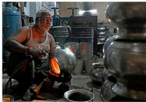
ifs and buts: The calorific value of PNG is a tad lower than LPG, according to officials of some MSMEs.