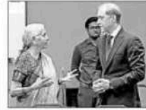
रूस के डेनिस उप प्रधानमंत्री डेनिस मंत्रोव ने गुरुवार को राष्ट्रीय सुरक्षा सलाहकार अजीत डोवाल और विदेश मंत्री एस जयशंकर के साथ नैटवर्क में ऊर्जा सहयोग पर विशेष रूप से चर्चा की।

दोनों देशों के बीच भारत-रूस अंतर-सरकारी अद्ययतन की बैठक में भी द्विपक्षीय संबंधों से जुड़े विभिन्न मुद्दों पर विस्तृत चर्चा हुई। इस बैठक को सह-अध्यक्षता मंत्रोव