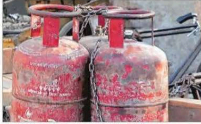
A filling station at Rajghat near Ring Road in Delhi. AMIT MEHRA

ference with the Delhi Police, Indraprastha Gas Limited (IGL), and OMCs, Additional Commissioner Arun Kumar, Department of Food, Supplies and Consumer Affairs, said that there are around 56 lakh domestic LPG consumers across the city and the government is