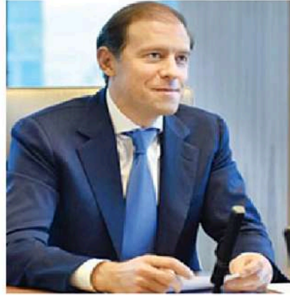
डेनिस मांटुरोव। फाइल

मांटुरोव की यात्रा के बाद रूस की तरफ से जारी सूचना के मुताबिक, उन्होंने पुष्टि की है कि रूसी कंपनियां भारतीय बाजार में तेल और एलएनजी की आपूर्ति को लगातार बढ़ाने की क्षमता रखती हैं। दोनों देशों ने द्विपक्षीय संबंधों को और मजबूत करने पर भी सहमति जताई है। रूसी पक्ष ने भारत-रूस अंतर-सरकारी आयोग की बैठक के