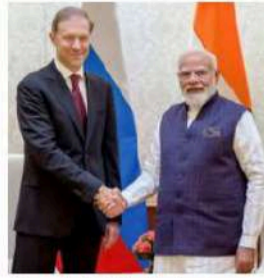
Narendra Modi with Russian Deputy PM Denis Manturov, in New Delhi, on Thursday.

"We discussed our mutually beneficial cooperation in trade, fertilizers, connectivity and people-to-people ties," said Mr. Modi, who "welcomed sus-