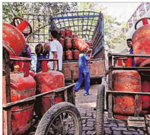
The Centre has also urged the states to help expedite the expansion of PNG network across the country.

Such measures, the government expects, will help free up LPG supplies from areas that have PNG connectivity, allow-