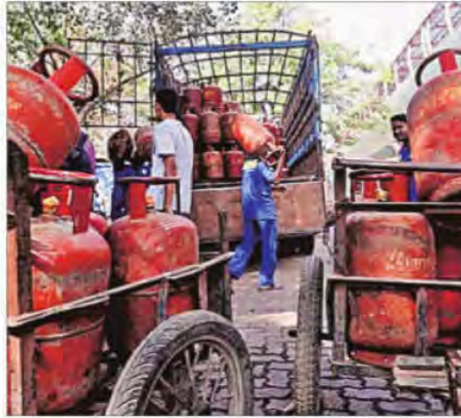
The Centre has also urged the states to help expedite the expansion of PNG network across the country.

Such measures, the government expects, will help free up LPG supplies from areas that have PNG connectivity, allow-