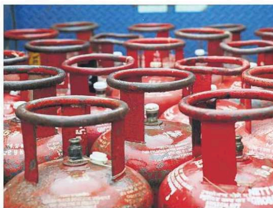
The government has been encouraging citizens to shift to piped natural gas and electric cooking.

The government has been encouraging citizens to shift to piped gas and electric cooking, apart from curtailing commercial LPG supplies, and raising commercial cylinder prices by a record ₹993. The move to