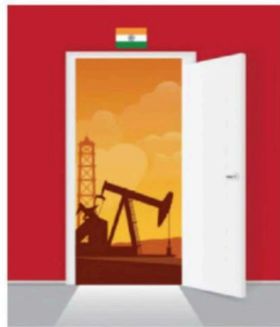
Illustration by RAJU VERMA

NEW DELHI HAS ENTRENCHED INTERESTS ACROSS ALL SIX GULF STATES, AND MANAGING SIX RELATIONSHIPS THAT NO LONGER MOVE IN TANDEM WILL TEST OUR DIPLOMACY