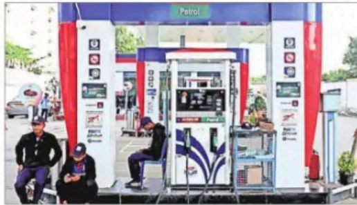
Despite a Rs 10 per litre excise duty cut on petrol and diesel in late March, OMC fuel sale losses persist.

On whether fuel rationing may be considered, the source said that there is "no rationing in the play" as it is done when