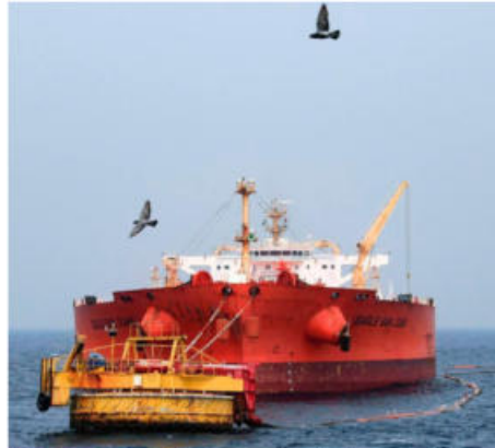
THE IMPACT. Official estimates show that the tax break is expected to result in a revenue loss of approximately ₹1,800 crore to the national exchequer

It clarified the decision was prompted by the escalating West Asia conflict and resulting turbulence in global supply chains. By removing these trade barriers, the government aims to shield the domestic market from external shocks. "This measure has been taken as a temporary and targeted relief in order to ensure continued availability of critical petrochemical inputs for domestic industry, reduce cost pressures on downstream