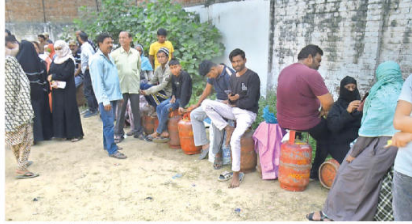
हापुड रोड पर तिरंगा गैस एजेंसी पर गैस सिलिंडर लेने का इंतजार करते उपभोक्ता • जागरण

घर जाकर लोगों को जागरूक किया गया कि वे पीएनजी कनेक्शन लें। दरअसल, इस कालोनी में हाल ही में तीन-चार घरों में नया कनेक्शन हुआ है इसलिए उसी क्रम में टीम ने लोगों को जागरूक किया।