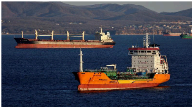
SLIPPERY TRADE. The shipments formed the single-largest destination for crude moved by Russia's expanding shadow fleet

After the Kremlin's full-scale invasion of Ukraine, Western countries imposed sanctions on Russian energy. Moscow is accused of dodging these by using shadow fleets — aged tankers operating in legal grey areas with obscure ownership, false registration papers and disabled tracking systems — to ship oil to consumers, including China, In-