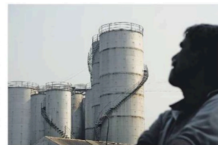
Indian refiners operating their own ships can ensure bans and sanctions on vessels don't majorly impact supplies.

"Taking into account running cost and depreciation, there may not be a major dif-