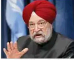
हरदीप सिंह पुरी

नई दिल्ली, (पंजाब केसरी): अब जबकि साल 2025 सम्पन्न होने के करीब पर हैं पेट्रोलियम एवं प्राकृतिक गैस मंत्रालय ने इस साल का अपना रिपोर्ट कार्ड पेश कर दिया है। नीतिगत सुधारों, बुनियादी ढांचे के विस्तार और स्वच्छ ऊर्जा पहलों के माध्यम से, पेट्रोलियम और प्राकृतिक गैस मंत्रालय ने 2025 के दौरान ऊर्जा तक पहुंच, सामर्थ्य, स्थिरता और सुरक्षा को मजबूत करने में महत्वपूर्ण प्राप्ति की। तेल और प्राकृतिक गैस की खोज एवं उत्पादन, शोधन, वितरण एवं विपणन, साथ ही इनके आयात, निर्यात एवं संरक्षण के लिए उत्तरदायी इस मंत्रालय ने इस साल कई अहम कदम उठाए, जिससे अभूतपूर्व परिवर्तन हुए हैं। भारत की बढ़ती अर्थव्यवस्था के लिए तेल और गैस आज भी सबसे अहम ईंधन हैं। साल 2025 में पेट्रोलियम और प्राकृतिक गैस मंत्रालय ने ऊर्जा को सस्ता, सुलभ और सुरक्षित बनाने के लिए कई बड़े कदम उठाए। इस साल मंत्रालय ने एनर्जी एक्सेस, एनर्जी इफ़ीसिएंसी, एनर्जी स्टोरेज, ईवी चार्जिंग, बायोफ्यूल और गैस पाइपलाइन तक हर मोर्चे पर काम किया ताकि आम लोगों को साफ और धरोसेमंद ऊर्जा मिल सके।