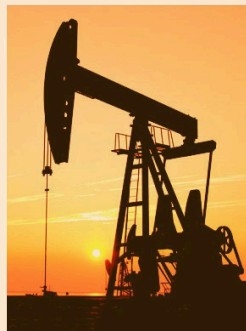
Trend of net oil & gas imports (in $bn)

The net oil and gas import bill, after accounting for India's petroleum exports, was down 4.12 per cent Y-o-Y at $9.3 billion in November. Lower energy prices are a big positive for India as the country is dependent on imports for around 90 per cent of its crude oil requirements and 50 per cent of natural gas needs.