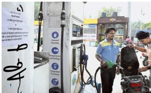
FLOATING ONE'S BOAT. Sugar and grain-based distilleries are seeking a hike in blending beyond 20%