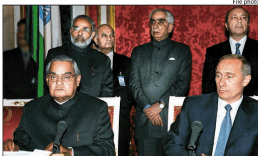
Modi and Putin have a long relationship that goes back almost 25 years. In 2001, Modi had accompanied then PM Vajpayee to Moscow

Putin highlighted defence cooperation with India, emphasising that his country also shares technology, and citing, among other instances,